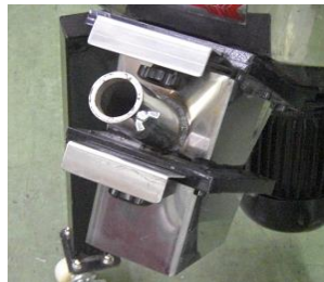
φ38ローダーノズル差込み口